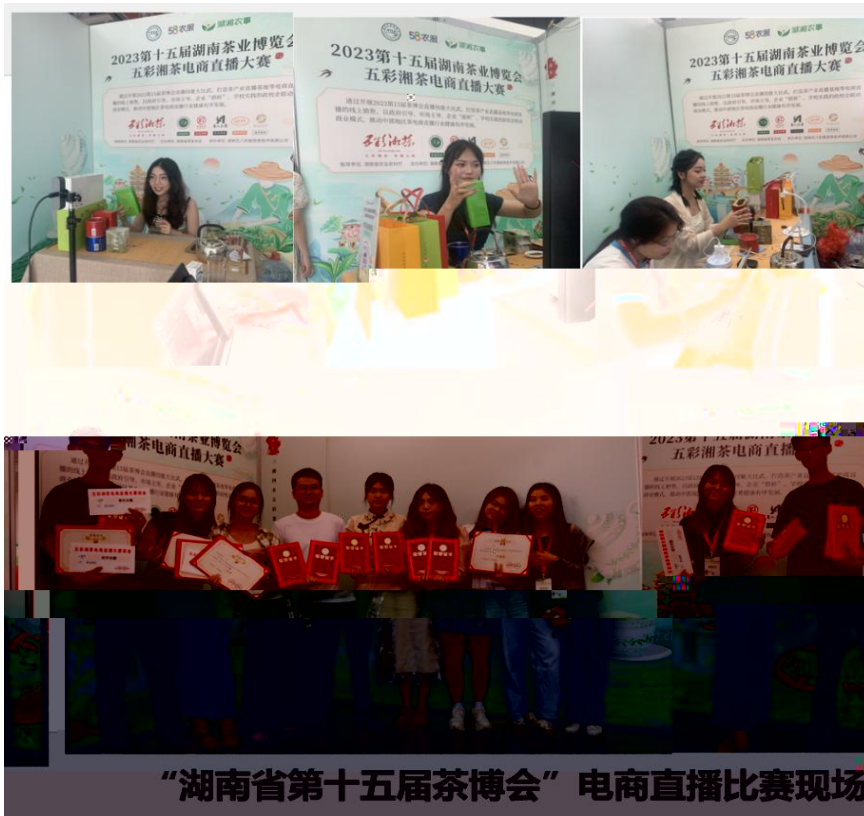
“湖南省第十五届茶博会” 电商直播比赛现场